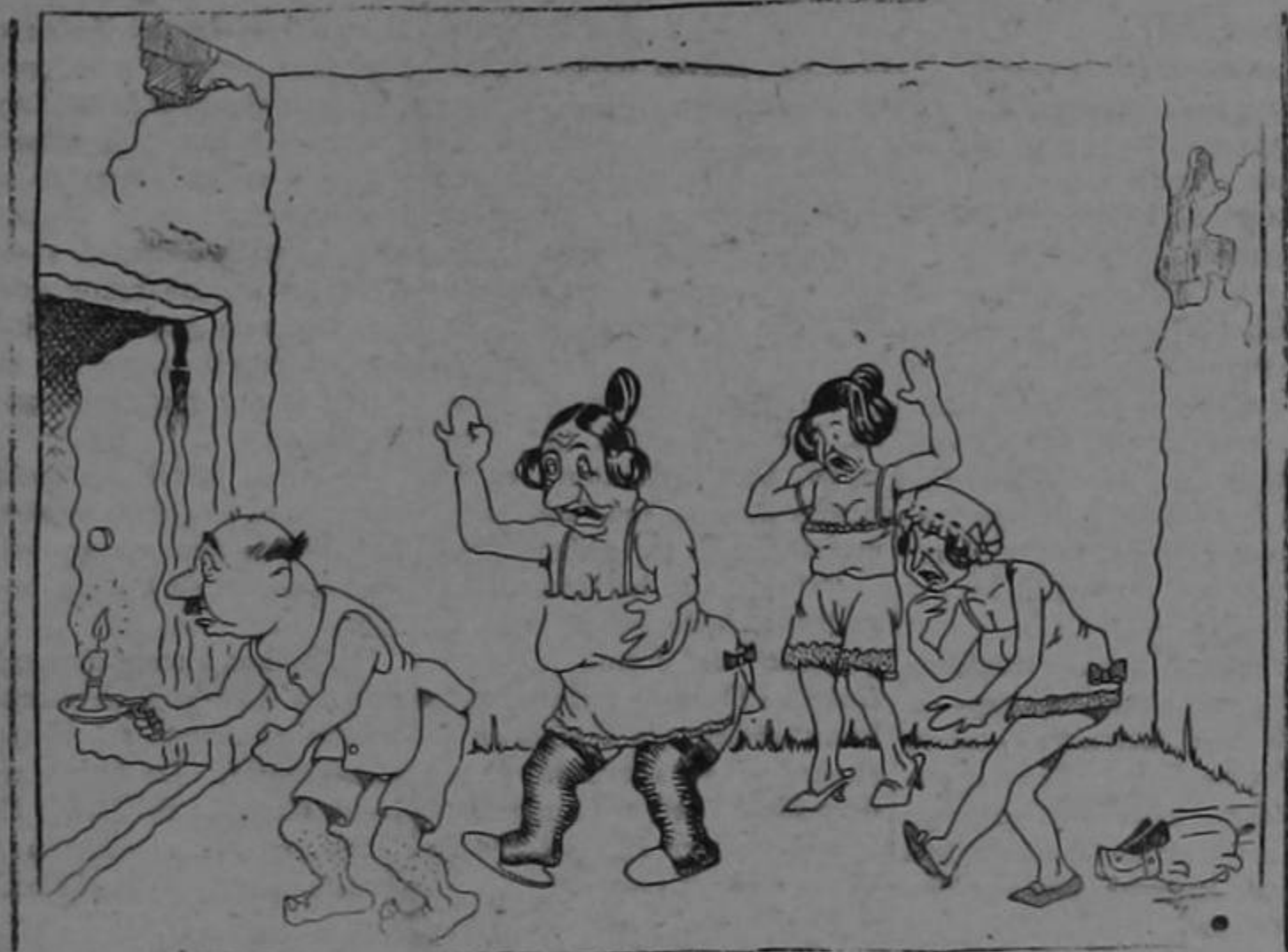
En casa de don Giuseppe Cuaranta

(Los cortesistas dicen que de un momento a otro estallará la revolución).