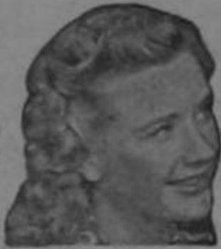
Priscilla Lane de la Warner Bros.

DE VENTA EN TODAS LAS BOTICAS Y DROGUERIAS