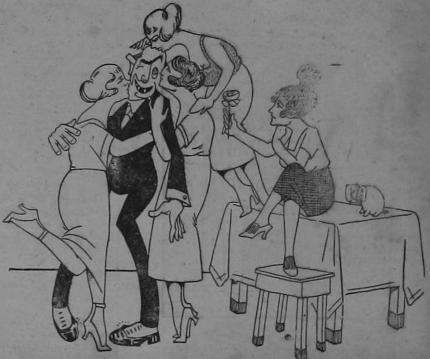
Desde ahora aguramos el recibimiento que le harán en el Aeropuerto.

de seda para mujeres. Como medio de propaganda se propone regalar medias entre las damitas de su amistad.